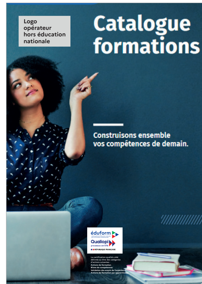
Structures hors éducation nationale