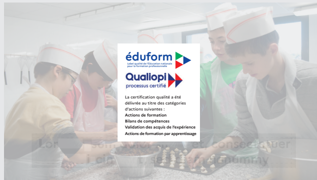
Écran de signature