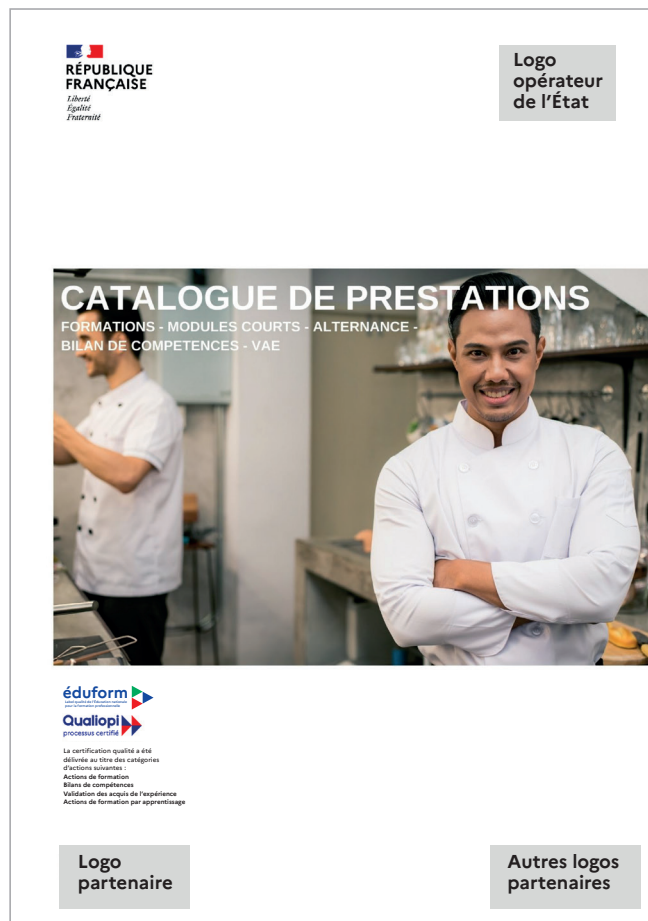
Structures éducation nationale

Quand l'émetteur n'est pas un opérateur de l'éducation nationale mais un organisme de formation privé, le label Éduform et la certification Qualiopi sont positionnés sur le document avec la mention République française (conformément à la charte graphique de l'État).