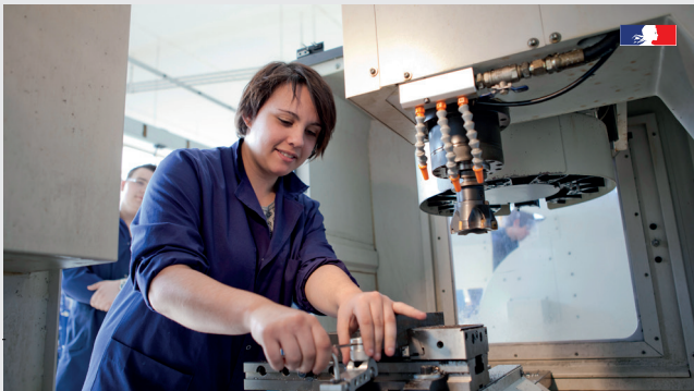
Écran de contenu