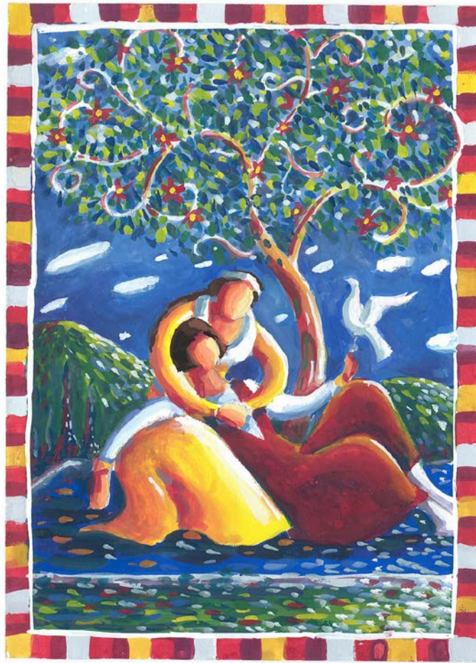
AUSSIBAL Luc, La colomba , ilustracion manlevada de PEYROUNY Martial, Trobadors , CRDP d'Aquitània, Bordeaux, 2009