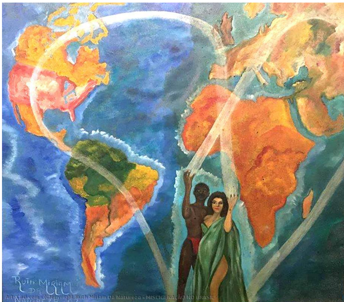
Métissage au Brésil , tableau de RUTH MIRIAM DA NATUREZA, 2002