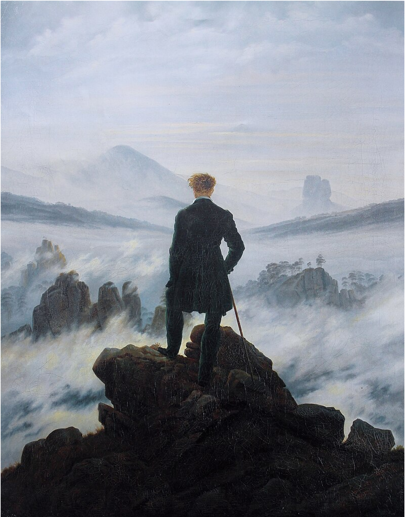
Caspar David Friedrich, Voyageur contemplant une mer de nuages , 1818, huile sur toile, 94,4 x 74,8 cm. Kunsthalle (Maison d'Art), Hambourg, Allemagne.