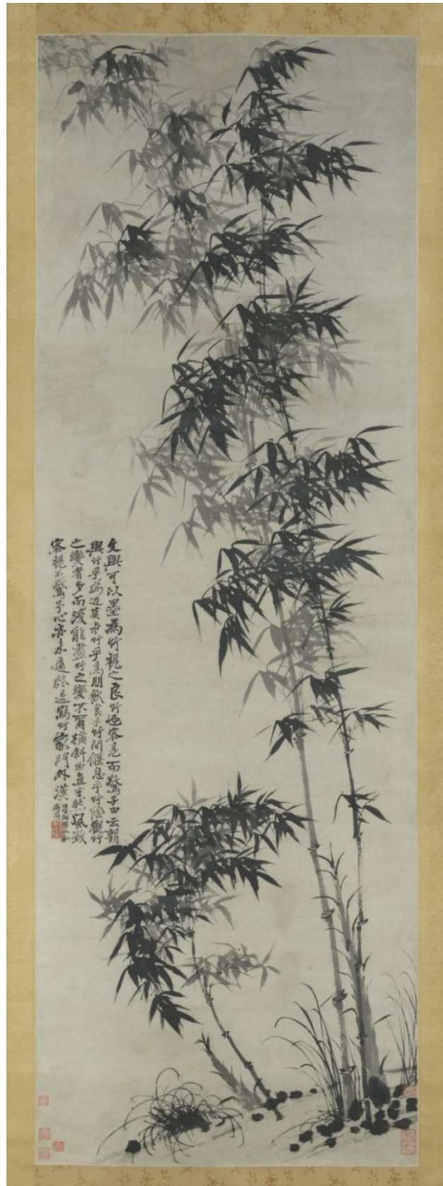
Zhū Rùojí, dit Shitao, Bambou dans le vent et sous la pluie , vers 1694, encre sur papier, 336 x 95 cm. The Metropolitan Museum of Art (Musée Métropolitain d'Art), New York, États-Unis.