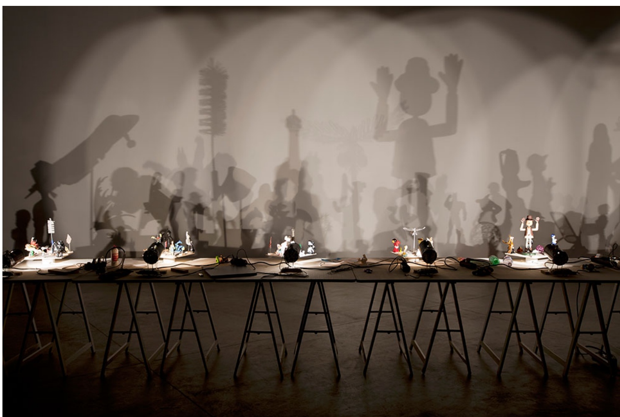
Hans-Peter Feldmann, Shadow Play (Jeu d'ombre), 2011, dimensions variables, bois, moteurs électriques, lampes, métal, céramique, plastique, papier, tissu, verre, jouets en fer blanc. Musée National d'Art Moderne (MNAM), Paris, France.