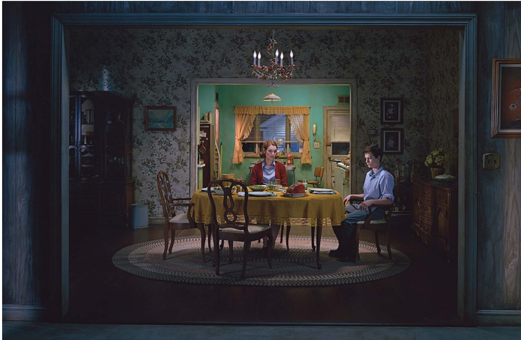
Gregory Crewdson, Untitled (Sunday Roast) (Sans titre [Le rôti du Dimanche]), de la série : Beneath the Roses (Sous les roses), 2003-2008, impression digitale, 144,8 x 223,5 cm. ALBERTINA Museum (Musée Albertina), Vienne, Autriche.