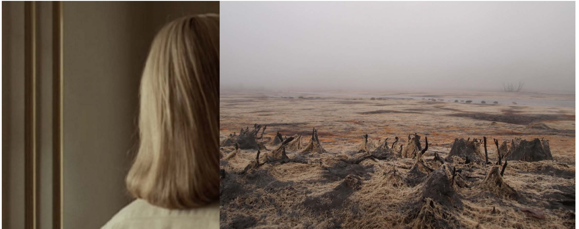
Anne-Sophie Emard, Kate , 2013, caisson lumineux, 50 x 125 cm. Collection FRAC (Fonds Régional d'Art Contemporain), Auvergne, France.