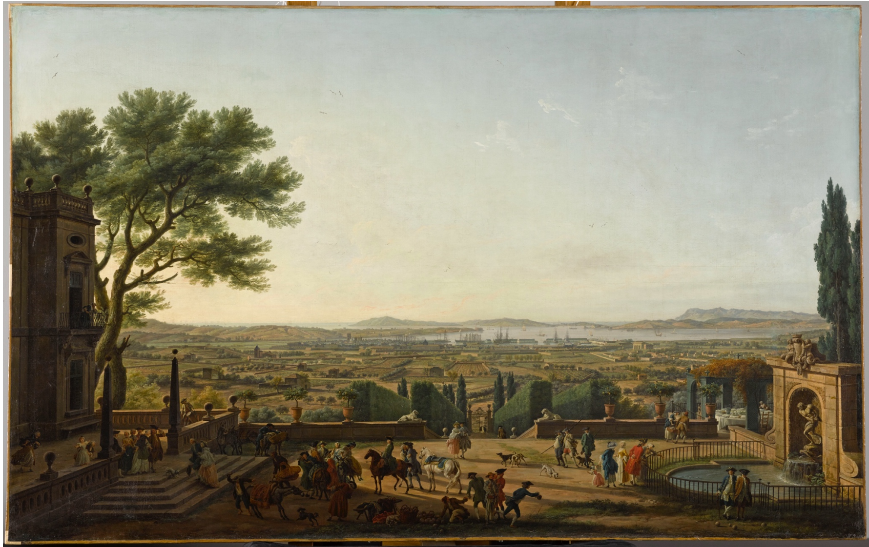
Joseph Vernet, La Ville et la rade de Toulon, deuxième vue, le port de Toulon, vue du mont Faron , 1756, huile sur toile, 165 x 263 cm. Musée du Louvre, Paris, France.