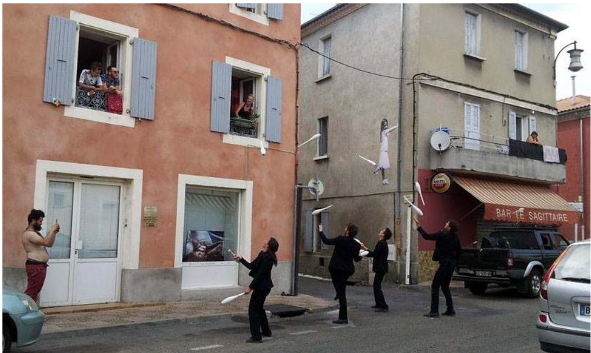
Collectif Protocole, One shot # 68 , INcircus avec La Verrerie d'Alès, 2017.