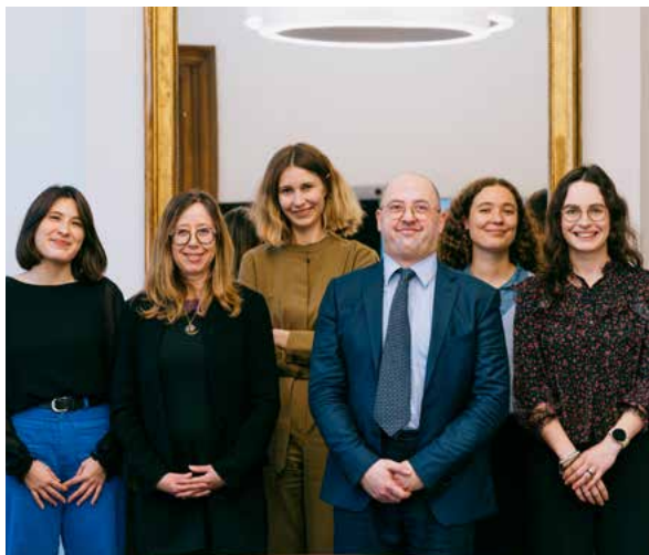
L'équipe du bureau A3