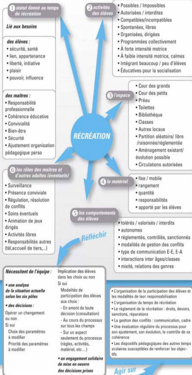
Schéma paru dans la revue Animation & Education - juillet-Octobre 2013 - n°235-236 Retrouvez l'intégralité de la démarche dans l'article en libre accès sur http://animeduc.occe.coop