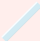
1 règle plate