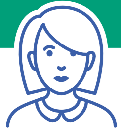
Fonctionnaires titulaires ou stagiaires

Toute personne physique, quel que soit son statut, dès lors qu'elle agit de manière désintéressée et de bonne foi :