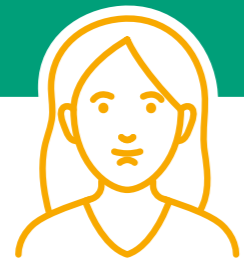
Collaborateurs extérieurs et occasionnels