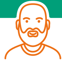
Contractuels de droit public ou de droit privé