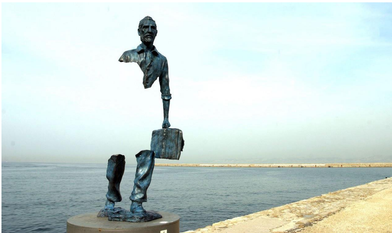
Bruno Catalano, Les voyageurs , scultura in bronzo, Marsiglia, 2013.

Bruno Catalano è un artista francese di origini siciliane, nato in Marocco nel 1960.