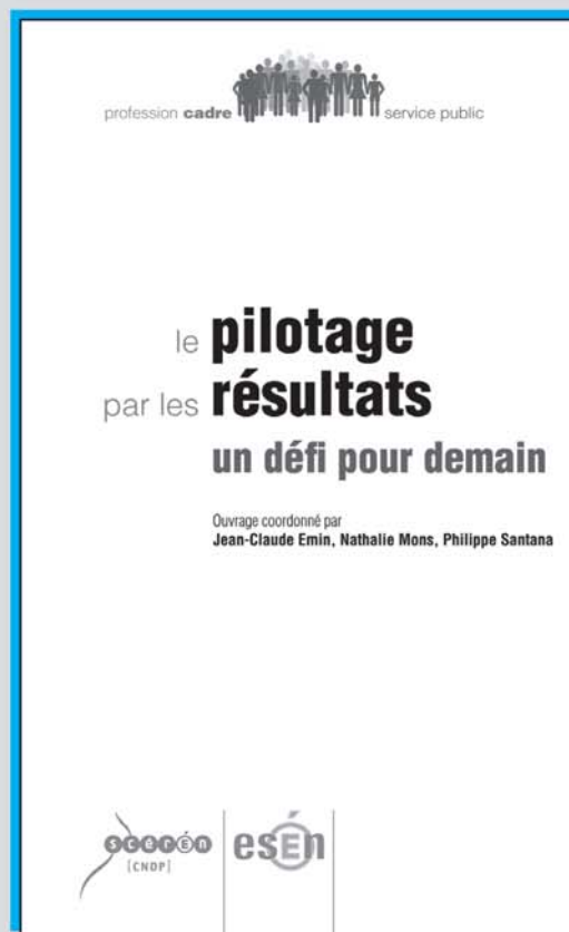
Le pilotage par les résultats Un défi pour demain CNDP – ESEN, 2009 | 755A3383 – 9,90 €