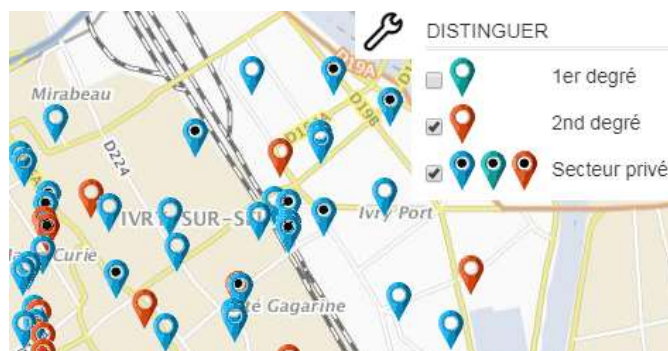
Critères pour distinguer les établissements sur la carte

Vous avez également la possibilité de distinguer les établissements. Un clic sur la clé à droite de la carte affiche une boîte de dialogue proposant les critères pour distinguer les établissements du premier degré, du second degré et du secteur privé. Plusieurs critères peuvent être activés simultanément.