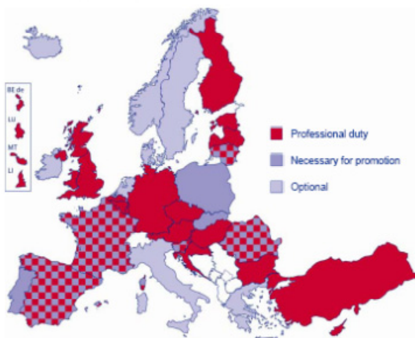
Figure E7: Status of continuing professional development for teachers in primary and general (lower and upper) secondary education (ISCED 1, 2 and 3), 2010/11